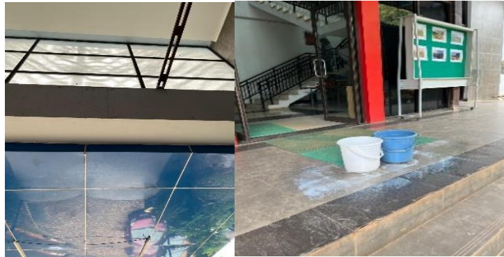
Gambar 3. Kondisi Gedung saat cuaca hujan

pelatihan bagi dosen, tenaga kependidikan, dan mahasiswa. Di samping itu, perbaikan sarana pada area rawan, seperti pengondisian udara yang belum optimal serta kabel listrik yang tidak terorganisasi dengan baik, menjadi prioritas yang harus segera ditangani.