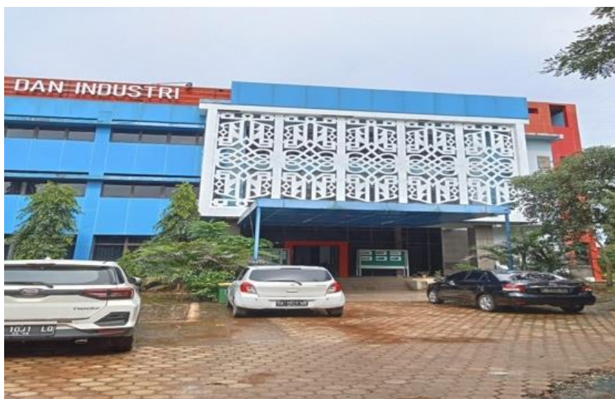
Gambar 1. Gedung Jurusan Rekayasa dan Industri

Gedung Jurusan Rekayasa Dan Industri adalah salah satu Gedung perkuliahan yang ada di Politeknik Negeri Tanah Laut atau (Politala) yang berlokasi di Desa Panggung, Kecamatan Pelaihari, Kabupaten Tanah Laut, Provinsi Kalimantan Selatan. Kampus ini terletak di jalur utama Pelaihari–Banjarmasin sehingga mudah dijangkau oleh mahasiswa maupun masyarakat umum. Letaknya yang berada di ibu kota kabupaten menjadikan Politala memiliki posisi yang strategis sebagai pusat pendidikan vokasi di wilayah Tanah Laut. Lingkungan kampus tergolong cukup luas dan mendukung kegiatan perkuliahan, praktikum, serta aktivitas mahasiswa lainnya.