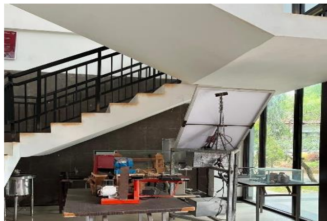
Gambar 4. Kondisi Tangga Bangunan