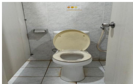
Gambar 7. Kondisi Fasilitas Toilet

Identifikasi potensi bahaya pada struktur Bangunan Gedung Jurusan Rekayasa dan Industri Politeknik Negeri Tanah Laut dilakukan melalui penerapan metode Hazard Identification, Risk Assessment, and Risk Conditioning (HIRARC). Tahapan ini dilanjutkan dengan manajemen risiko guna mengukur tingkat bahaya pada setiap aktivitas kerja sekaligus merumuskan langkah mitigasi yang efektif. Adapun hasil evaluasi menggunakan pendekatan HIRARC tersebut dipaparkan sebagai berikut: