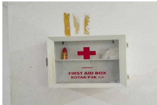
Gambar 6. Kondisi Fasilitas P3K